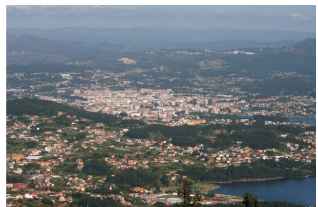
Vista sobre Pontevedra