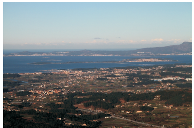
Vista sobre a Illa de Arousa