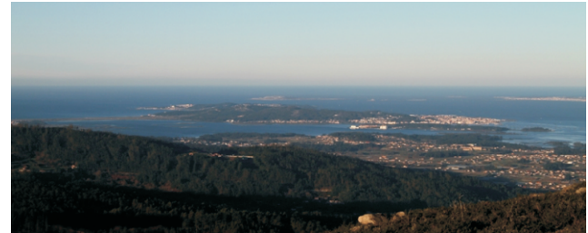
Vista sobre O Grove e A Toxa