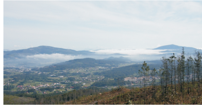
Vista sobre o Salnés, ao fondo os montes Xiabre e Xesteiras

O inicio da ruta é no primeiro cruzamento á dereita. Séguese cara arriba sen coller ningún desvío ata chegar ao alto en que vira á esquerda e nos conduce ata o primeiro cume. Logo segue pola parte alta ata a última caseta de vixilancia e a partir de alí comeza o descenso ata o punto de partida.